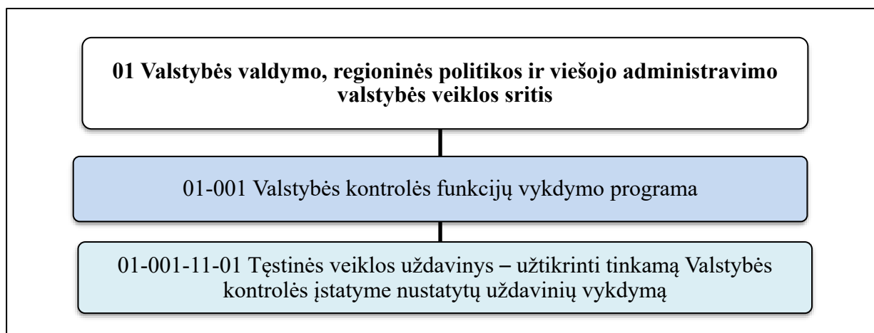
2 grafikas. Valstybės kontrolės funkcijų vykdymo programa ir jos uždaviniai

Programos vykdytojai yra Valstybės kontrolės darbuotojai: valstybės pareigūnai (vadovybė) ir pagal darbo sutartį dirbantys darbuotojai.