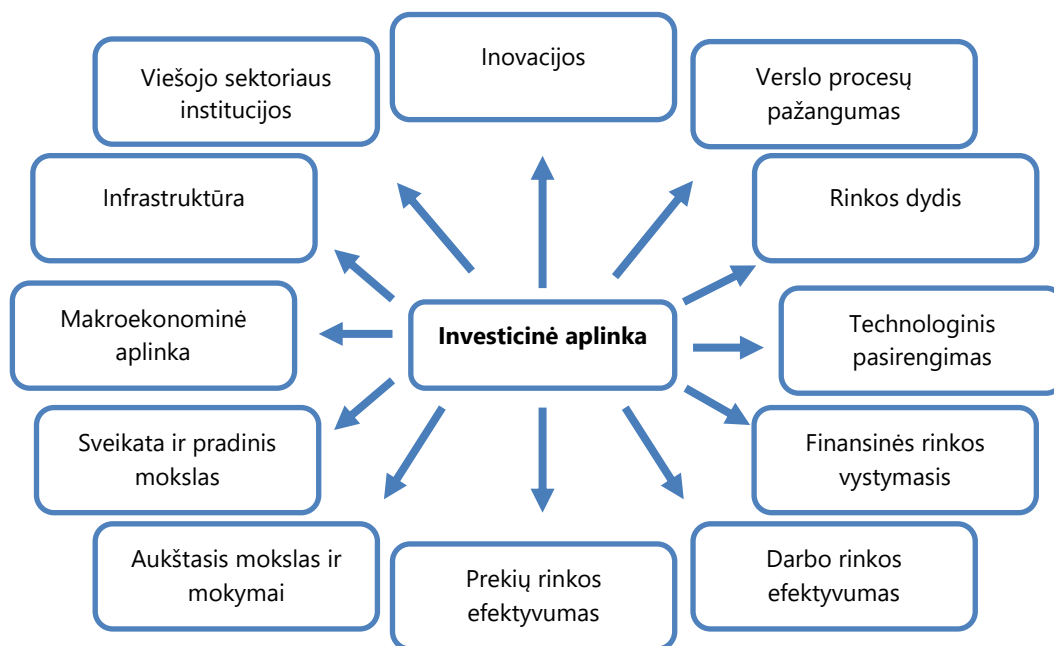
1 pav. Investicinės aplinkos komponentai

Šaltinis – Valstybės kontrolė pagal Pasaulio konkurencingumo indekso rodiklius